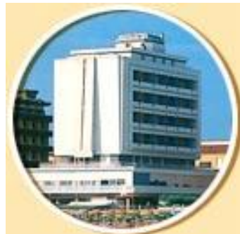
Hotel Capitol – unsere Unterkunft

Nach der individuellen Anreise trafen sich die Teilnehmer im Hotel Capitol, wo wir sehr freundlich und teilweise sogar auf schweizerdeutsch empfangen wurden. Nach dem Zimmerbezug konnte bei einem ersten Blick aus dem Fenster beobachtet werden, mit welcher Akribie der unmittelbar vor dem Hotel liegende Sandstrand bearbeitet und für die bevorstehende Badesaison vorbereitet wurde. Täglich war irgendjemand damit beschäftigt den Sand aufzurauen und von Unrat zu befreien.